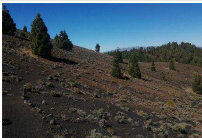
Fra toppen af La Palma med udsigt til Tenerife