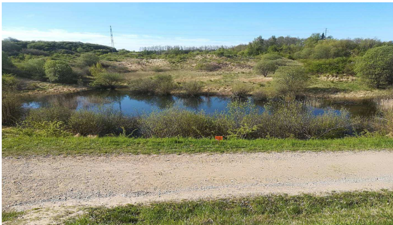
Billedet er fra Hedelandsvandringen i 2018

Starttider: Kl. 09.00 - 10.00: 20, 26 og 30 km. Kl. 09.00 - 11.00: 16 km. Kl. 09.00 - 12.00: 6 og 10 km. Hjemkomst senest kl. 16.00.