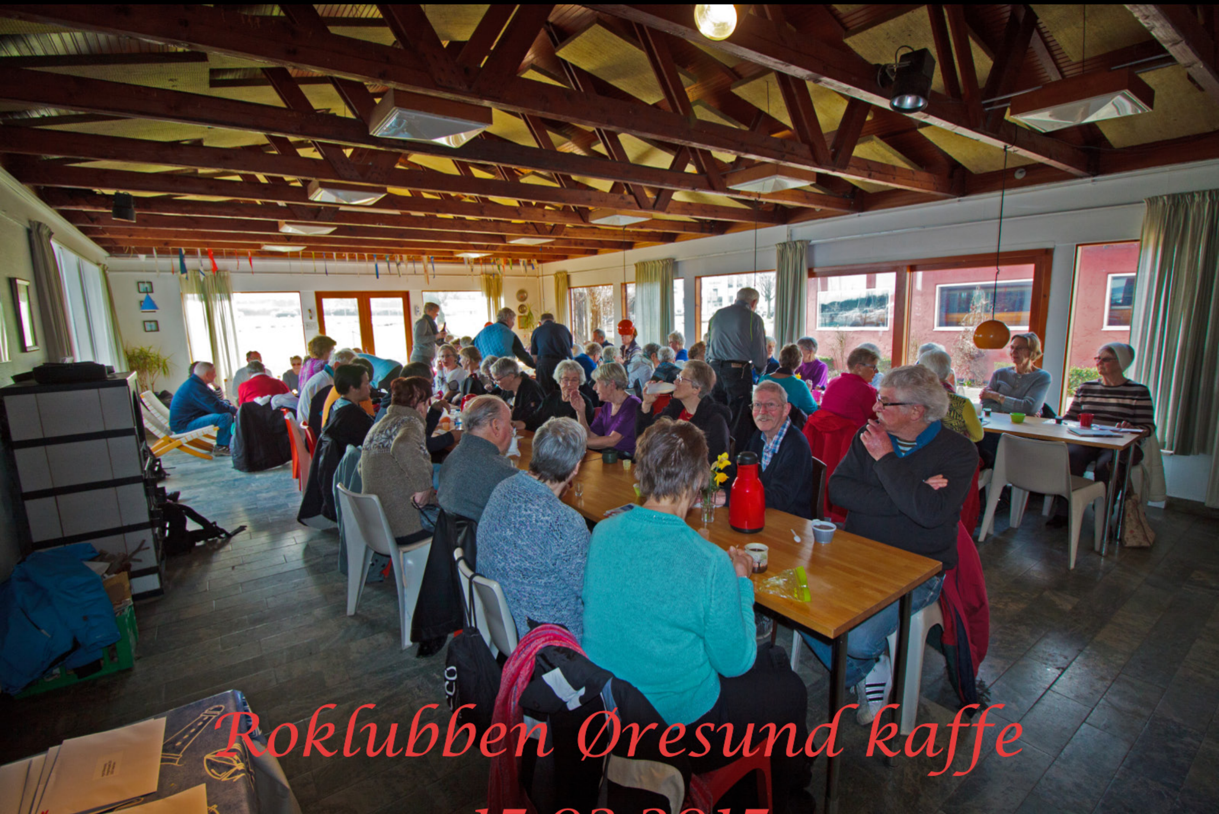
Roklubben Øresund kaffe 15.03.2015