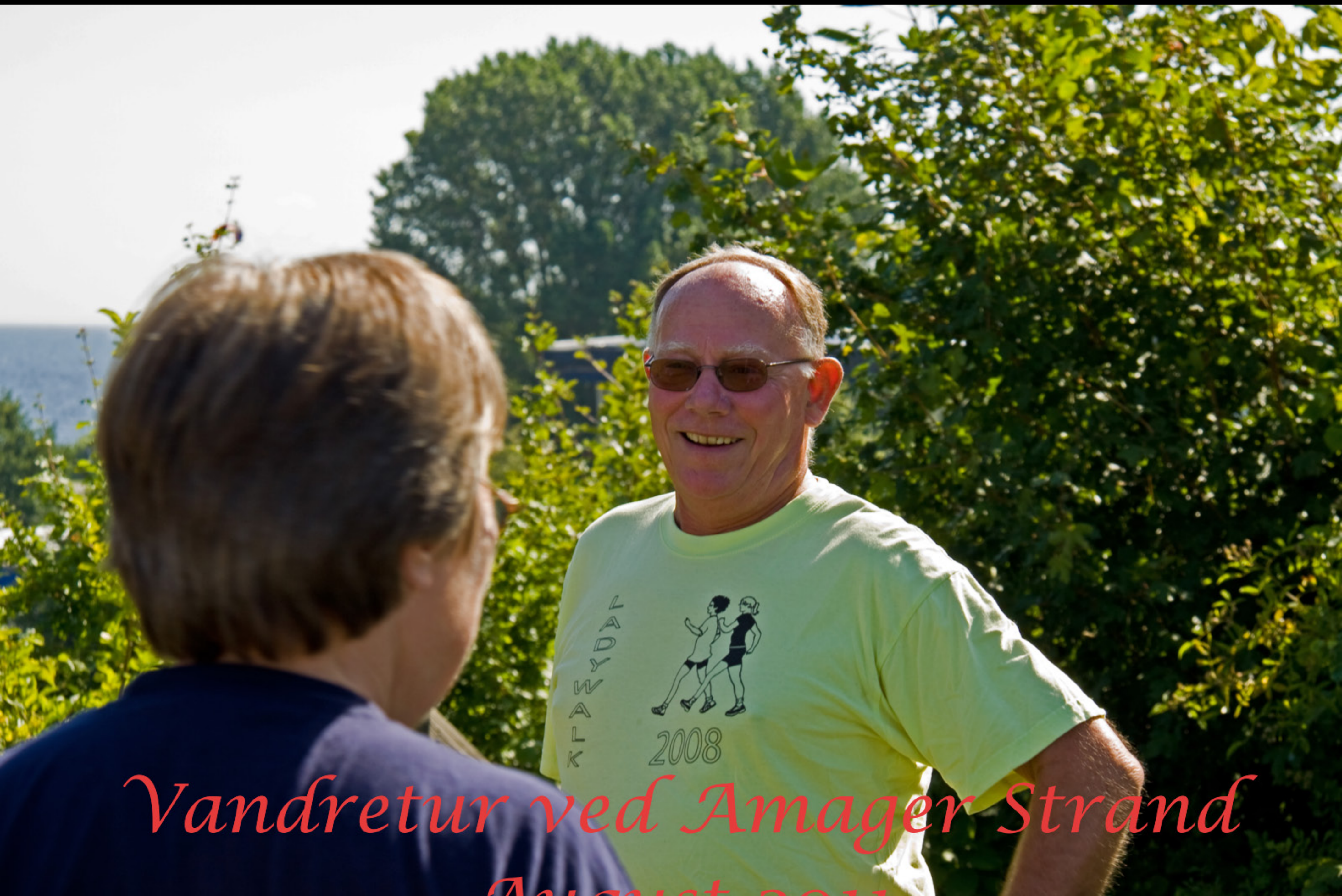
Vandretur ved Amager Strand August 2011