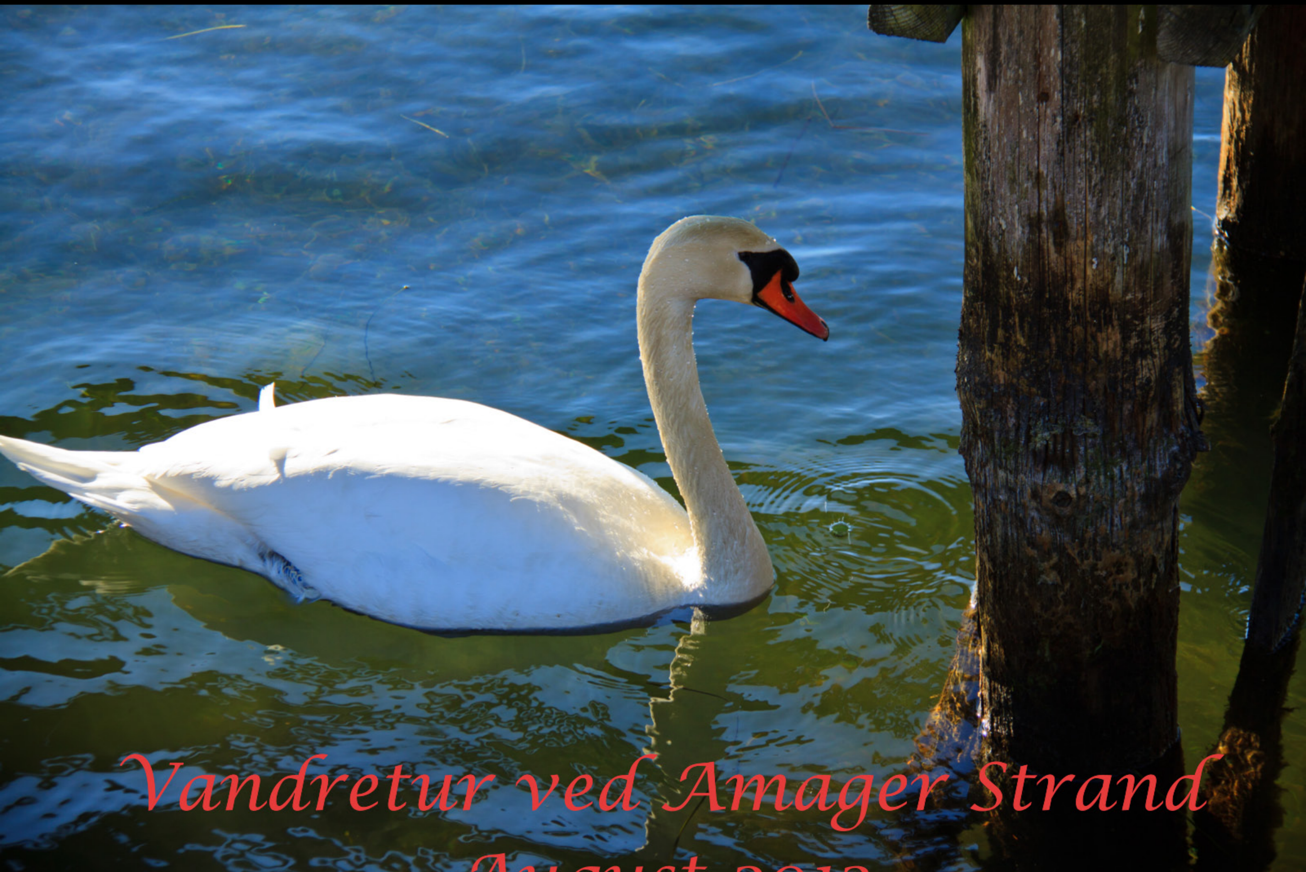
Vandretur ved Amager Strand August 2013