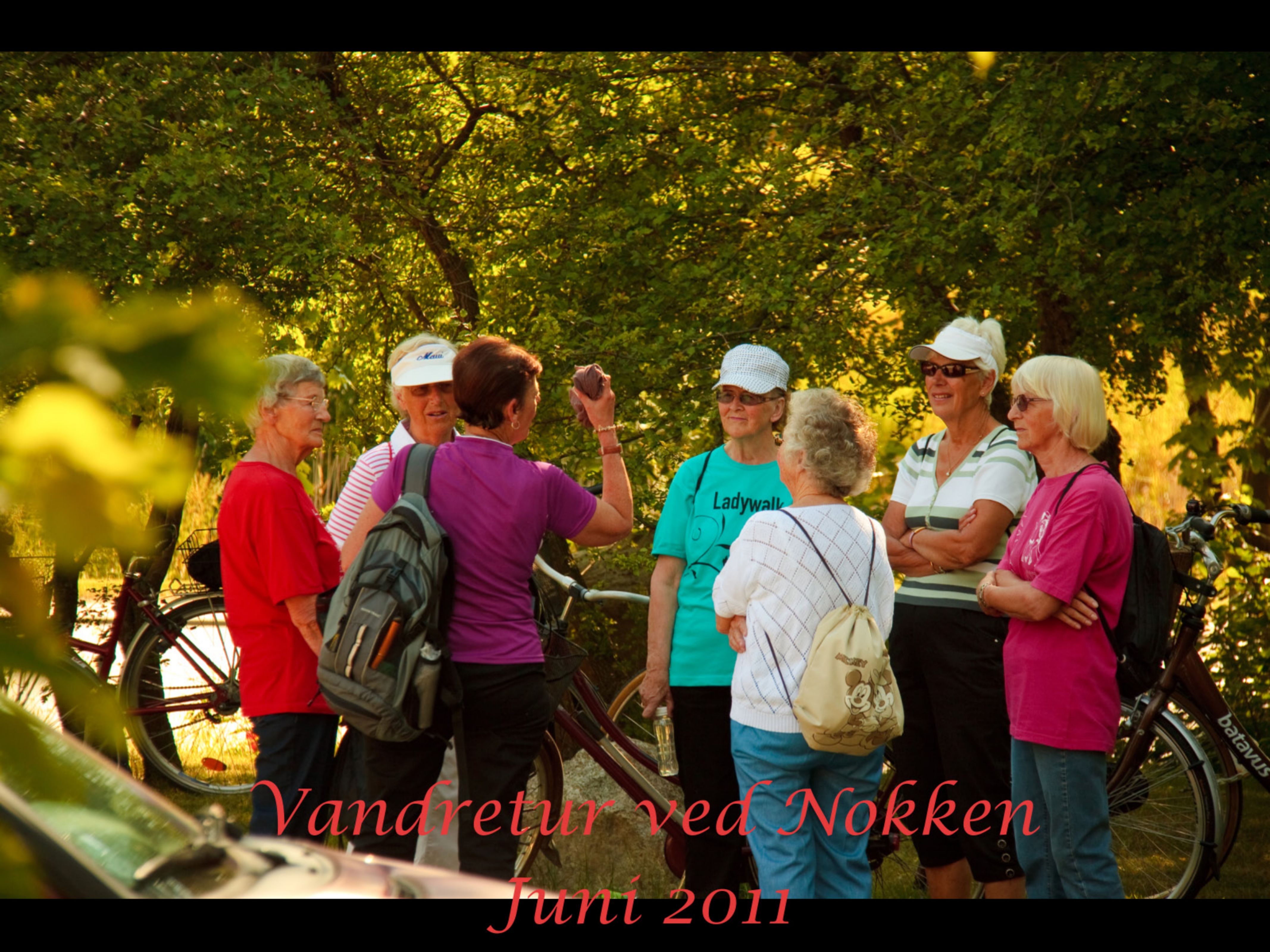
Vandretur ved Nokken Juni 2011