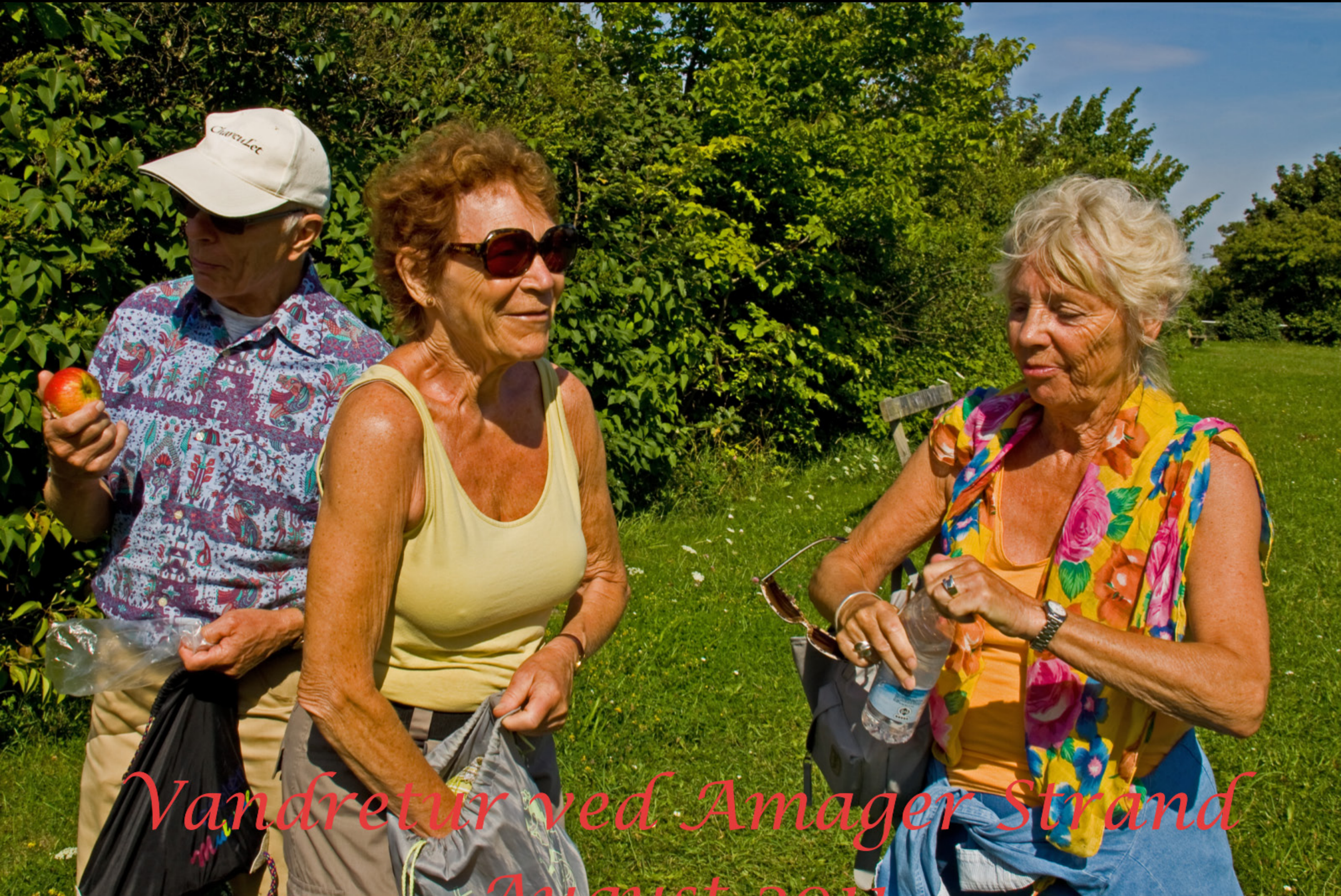
Vandretur ved Amager Strand August 2011