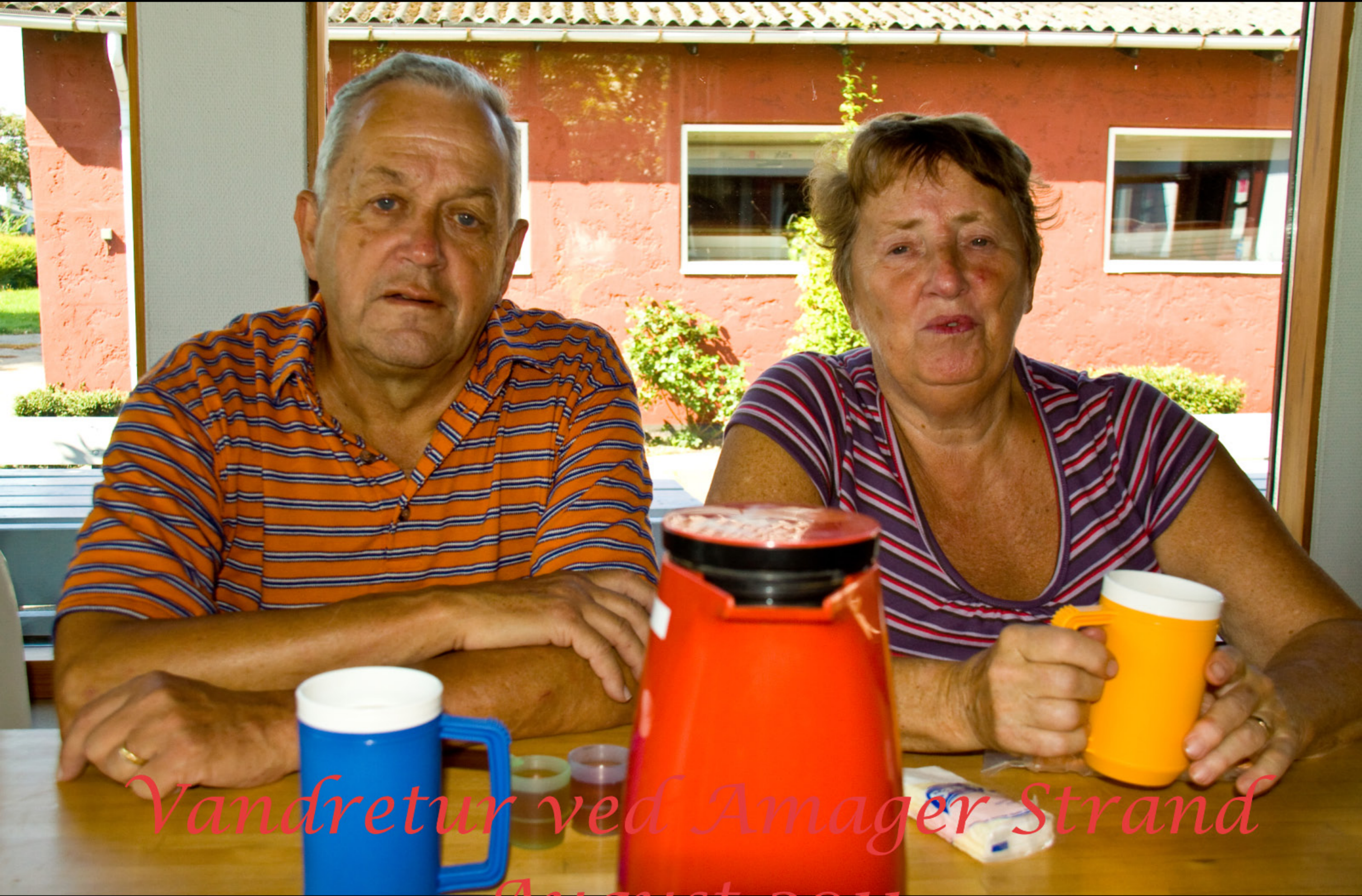
Vandretur ved Amager Strand August 2011