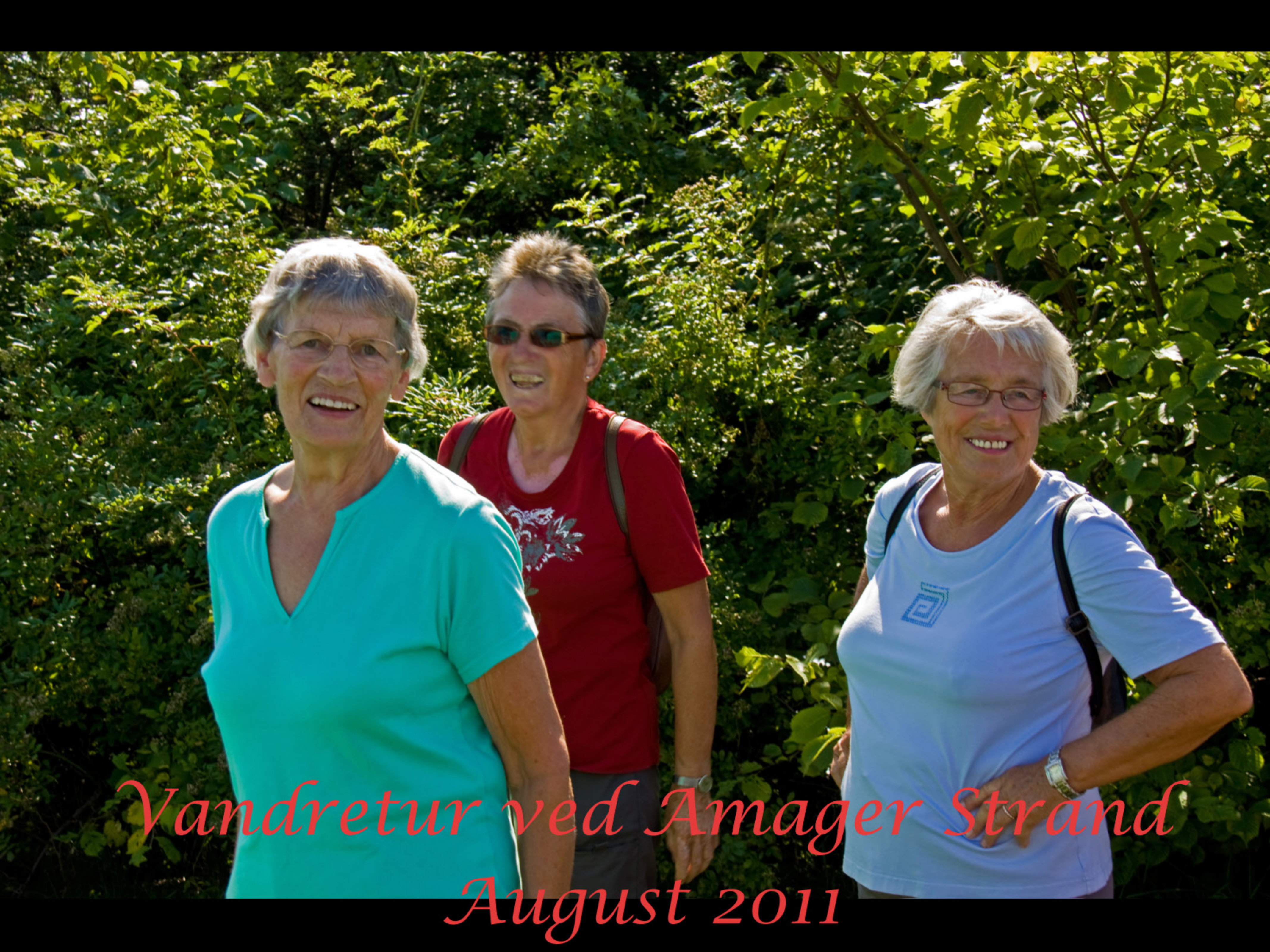
Vandretur ved Amager Strand August 2011