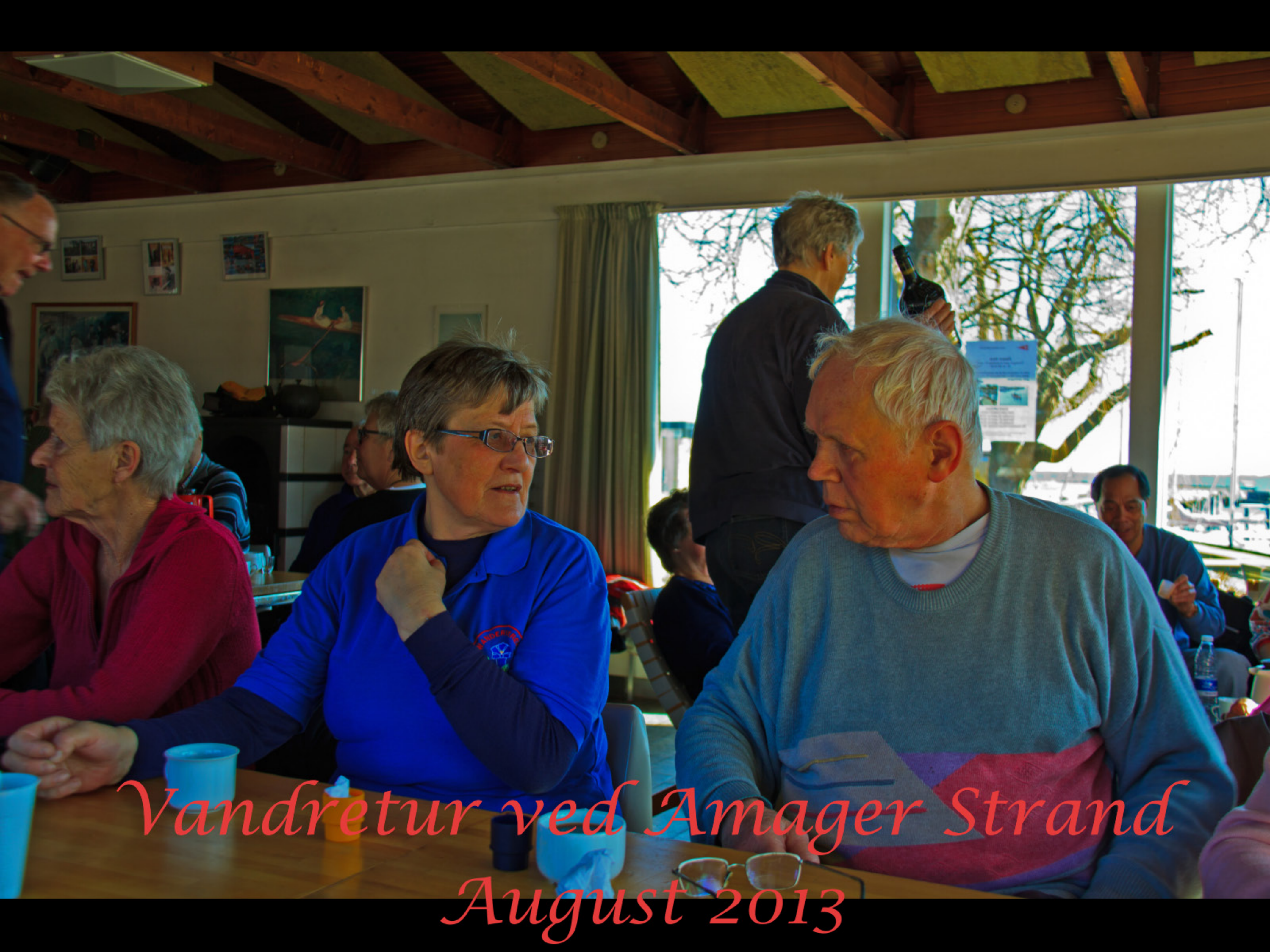
Vandretur ved Amager Strand August 2013